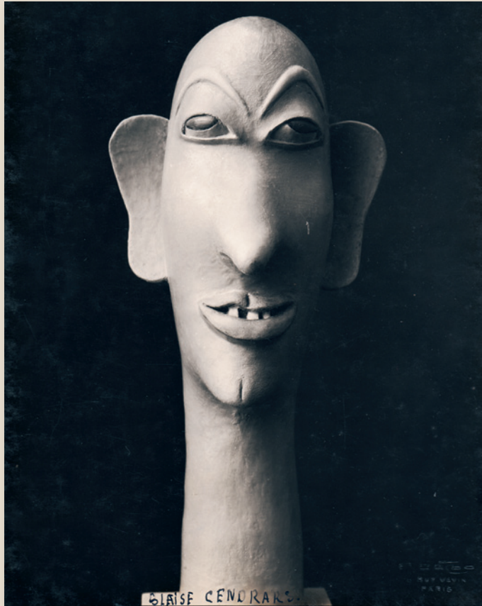
Marie Vassilieff, Poupée-Portrait Blaise Cendrars, 1922, Silbergelatine